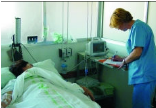
Una embarazada antes del parto.

El Hospital Virgen de las Nieves se sitúa como referente para todos los centros maternos del país