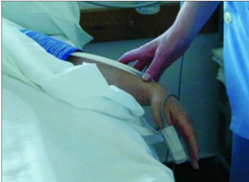
El personal del Materno Infantil asesora en todo momento a las embarazadas.

El 100% de las embarazadas que reciben asistencia en el Hospital Virgen de las Nieves son informadas de la posibilidad de hacer uso de este tipo de anestesia el día de su parto. Entre enero y junio de este año, más de 2.000 nacimientos han tenido lugar en el Hospital Materno Infantil -con una media de 343 alumbramientos por mes, 11 al día-. Partos naturales (vaginales), sin necesidad de cesárea, han sido 1.731. En éstos, la anestesia Locorregional (epidural) fue aplicada a casi 1.300 mujeres, lo que supone un 75%, cinco puntos más que durante todo el año pasado, cuando la cifra apenas superó el 70%. Hasta ahora, no ha habi-