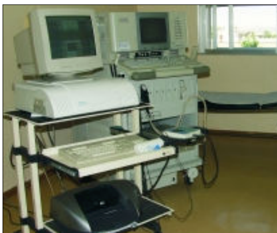
Consulta de Neurología.

Situación en la que progresivamente se van perdiendo las capacidades intelectuales previas, lo que se traduce en dificultad para realizar las actividades cotidianas, para comunicarse de forma eficaz y, finalmente, dependencia para las actividades básicas de la vida diaria (que son las que se refieren al autocuidado: vestirse, asearse, alimentarse, etc.)