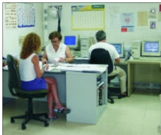
Despachos en Salud Mental de la Cartuja.