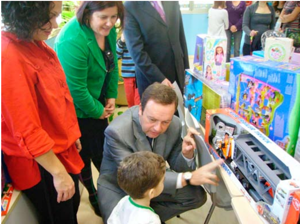
Los delegados entregan regalo a un menor

El delegado del Gobierno, Jesús Huertas, y la delegada de Salud, Elvira Ramón, visitaron a los menores ingresados en los hospitales públicos para entregarles regalos de la campaña informativa que la Consejería de Gobernación desarrolló durante las fiestas navideñas para promover el consumo de juguetes de calidad, seguros y que potencien valores de igualdad.