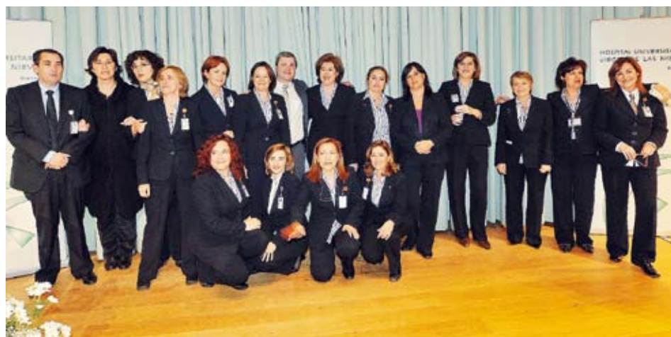
Profesionales del Servicio de Atención al Usuario del hospital