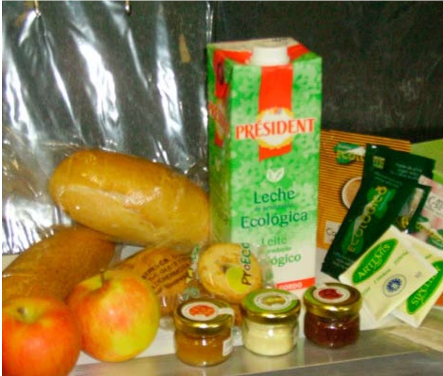
Alimentos ecológicos del hospital.

El encuentro se organizó en torno a la preparación para los pacientes de menús de restauradores de prestigio y un curso de seguridad y calidad alimentaria