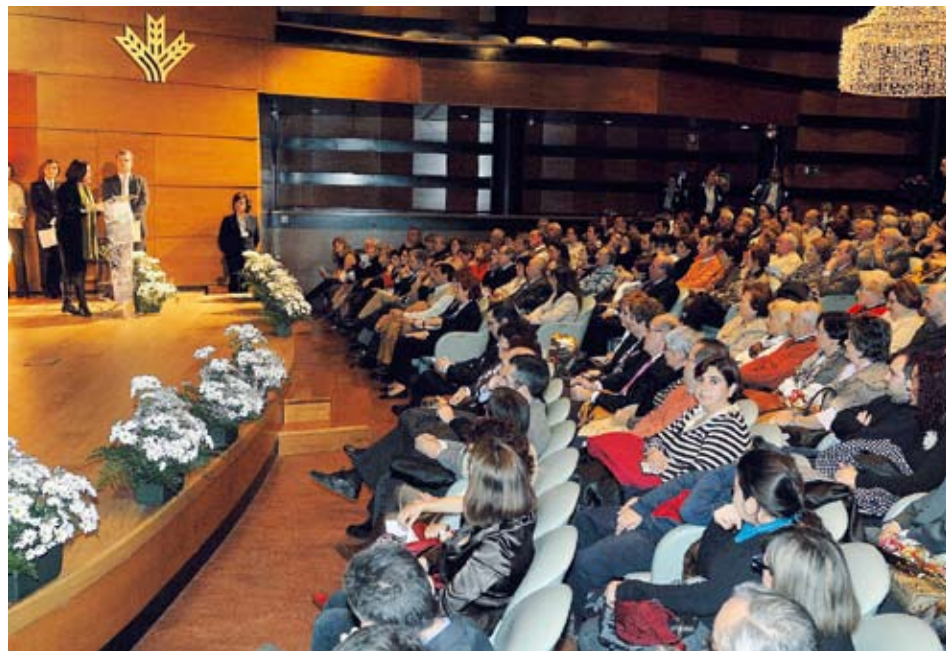
Vista general del evento

Tras dos horas de emociones, el encuentro fue clausurado por el director gerente que alabó la labor de las profesiona-