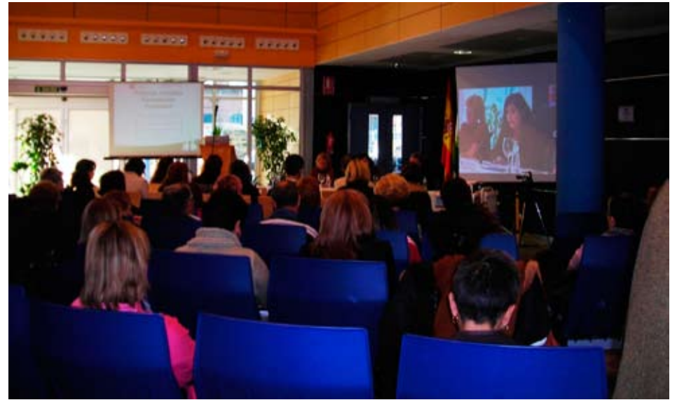
La delegada de salud en las jornadas

La tercera mesa estuvo compuesta por tres asociaciones con amplias raíces en la comarca: Asociación a favor de las