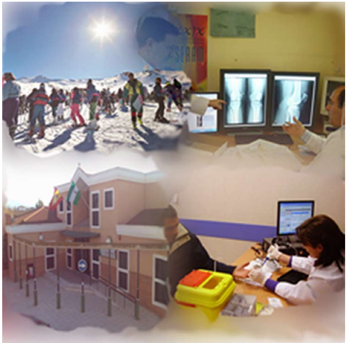
Proyectos de telemedicina

Entre las iniciativas en las que está trabajando la Unidad de Informática y Nuevas Tecnologías destacan las que tienen como