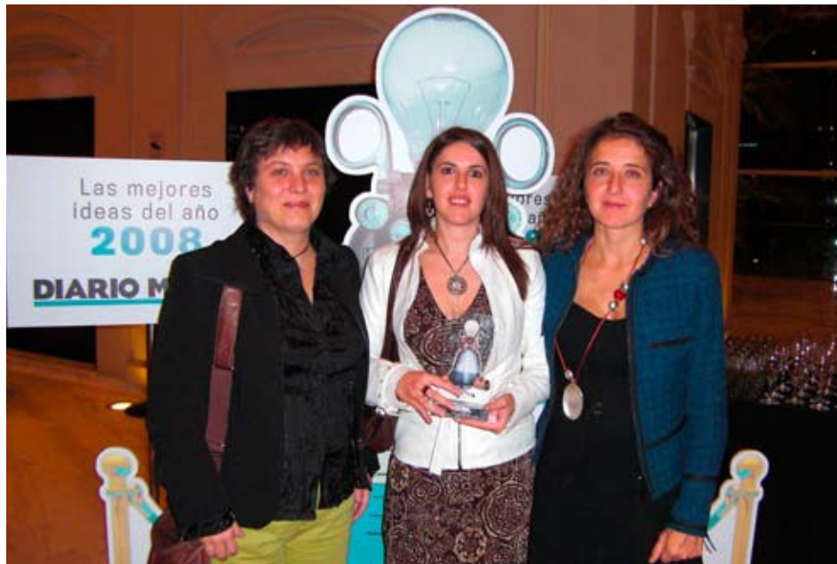
Responsables del proyecto recogen el galardón

El recorrido parte de un quiosco de acogida que lleva incorporado un panel informativo electrónico ubicado en el vestíbulo en el que desarrolla su labor el personal del Servicio de Atención al Usuario. A