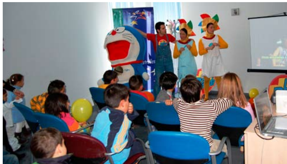
Personajes de la banda visitan Guadix

El programa Mundo de Estrellas se puso en marcha en 1998 como un espacio virtual de ocio y esparcimiento durante su ingreso hospitalario. Asimismo, sirve de ventana de contacto con otros hospitales andaluces y permite la comunicación entre menores ingresados en diferentes centros, lo que favorece el trato personal, aprender de las experiencias de otros niños y conocer que en otras partes de Andalucía hay menores en su misma situación. ●