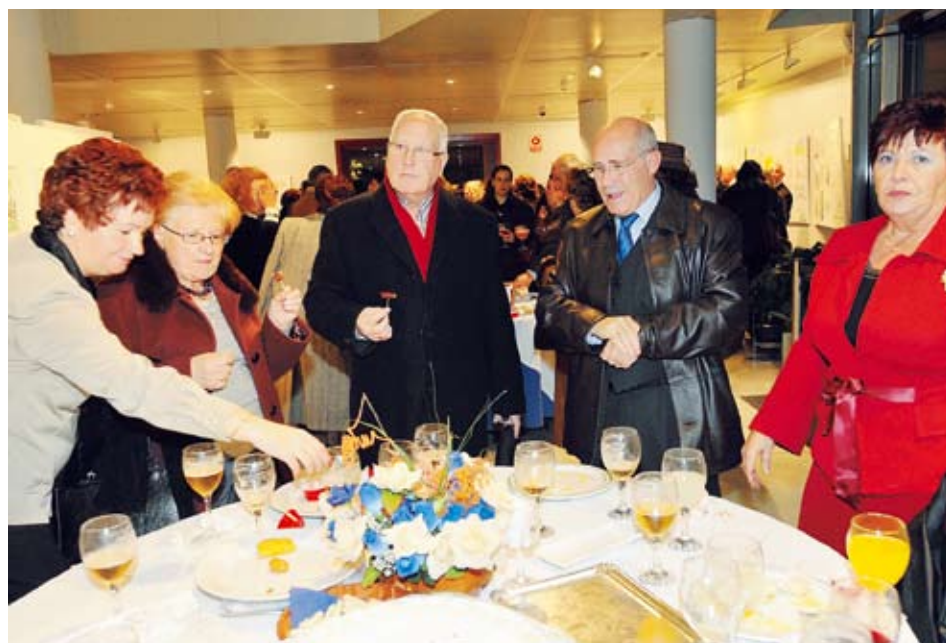
Invitados disfrutando del ágape final

les del Servicio de Atención al Usuario y de Atención al Profesional, responsables de la cuidada organización de este acto festivo.