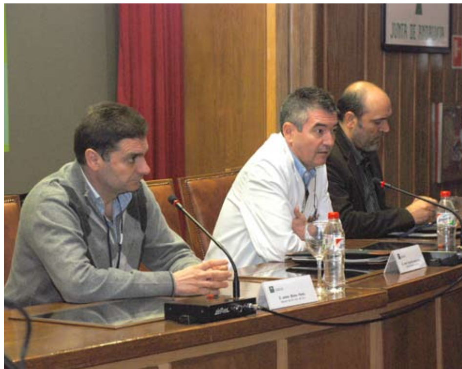
Presentación de las jornadas

Para concluir, se destacó la necesidad de que los profesionales de Mantenimiento integren en su concepto de trabajo que