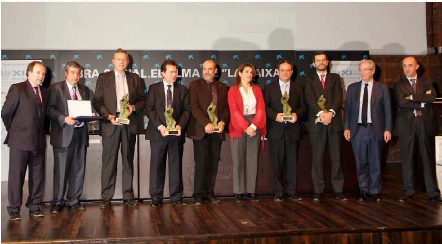
Entrega de los premios Garrigues