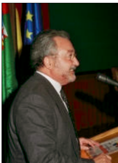
Bernat Soria durante un acto

La primera cuestión que cabe plantearse al analizar la actividad desarrollada por cualquier organización es cuál ha sido la evolución del mercado y los recursos disponibles para llevarla a cabo. El primer elemento que destacaremos en ese entorno cambiante es el principal recurso y base de nuestra actividad asistencial, la población (nuestro mercado). Y ello está vinculado al volumen de recursos fi-