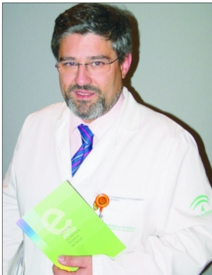
El director gerente presenta el libro de estilo.

Además, este texto sirve de guía práctica a los trabajadores sanitarios, porque se dan consejos como ir identificados durante su estancia hospitalaria para que los usuarios conozcan quién les está atendiendo, también se define qué información no clínica debe proporcionarse a los pacientes y sus acompañantes y qué hacer en caso de conflicto con los usuarios.