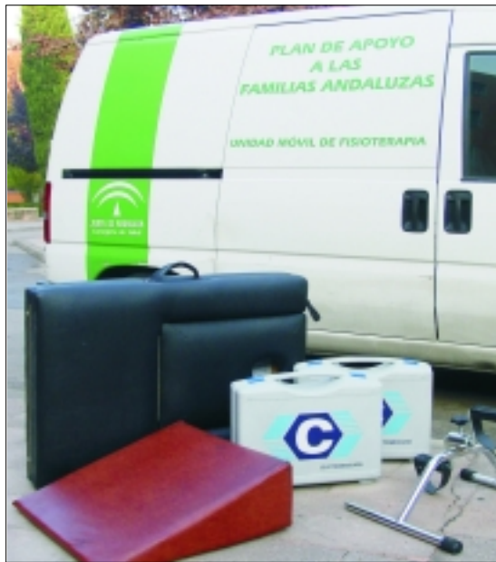
Vehículo y equipo de la Unidad Móvil de Fisioterapia

Esta dedicación en exclusiva al domicilio supone un impor-