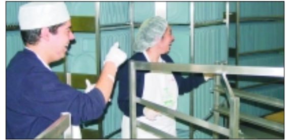
Jóvenes de la Asociación en la cocina del Hospital.

El Virgen de las Nieves es el primer centro hospitalario granadino que desarrolla una iniciativa de este tipo. También para los jóvenes de la Asociación Borderline es una nueva experiencia, ya que antes habían hecho pequeñas actividades en cursos de formación profesional, pero "ahora es más positivo para ellos, porque desempeñarán su actividad durante un periodo más largo que unas prácticas".